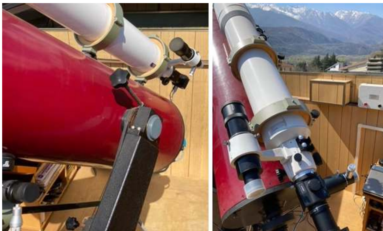
Vista della strumentazione nella specola del Grange Observatory, con il telescopio riflettore di 30 cm con il tubo isolante di bachelite ed una camera foto/astrometrica professionale (campo utile di 10.5x10.5 arcominuti), con il tubo bianco del rifrattore di 140 mm con una camera per riprese infrarosse

Brian Marsden (1937-2010) nei messaggi per l'assegnazione del codice astrometrico all'osservatorio, MPC 476, via terminale mi augurò di mandare molte altre misure, ed oggi posso dire di aver superato le 400 misure astrometriche inviate tra asteroidi e comete, anche nel 2020 tramite il telescopio robotico in SPE.S, l'osservatorio dell'AAS sul Castello della Contessa Adelaide in Susa, di cui sono il direttore scientifico. Nel frattempo al Grange Observatory di Bussoleno un telescopio rifrattore con 140 mm di diametro sostituì definitivamente nel 2015 l'80 mm sul tubo in bachelite del telescopio principale, su cui una camera CCD, professionale per la gestione del tempo d'osservazione, ora viene usata per la fotometria e l'astrometria, che mi ha permesso di inviare altre misure precise all'MPC con una formulazione a 80 colonne, antico retaggio delle schede perforate usate al Politecnico. Tale telescopio di 30 cm ora adotta la sua configurazione Cassegrain (ovvero catadiottrica) per l'osservazione diretta e per montarvi la camera con un fuoco ridotto a 2.5 metri dai 10 metri originali, su mia richiesta impostati dall'ottico veneziano Romano Zen, dagli anni '70 fornitore anche dell'osservatorio professionale di Padova, e di astrofili evoluti in grado di integrare meccanicamente le sue ottiche: negli anni '80 il mercato non offriva telescopi completi più grandi di 20 cm, diversamente da oggi.